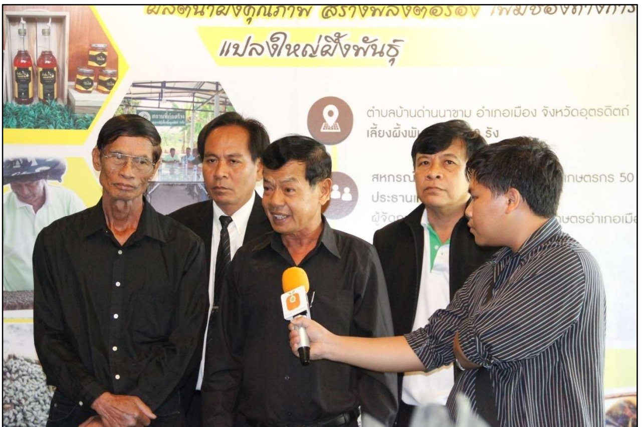
~ ศูนย์ส่งเสริมและพัฒนาอาชีพการเกษตร จังหวัดอุดรธานี ~